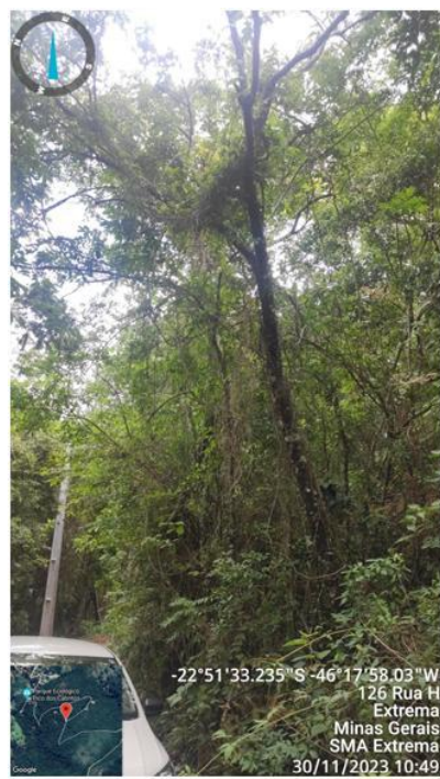
Figura 5. Árvore n.13