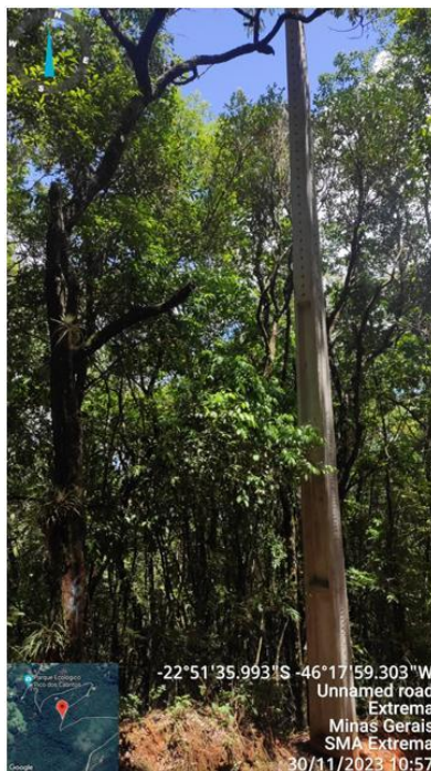
Figura 8. Árvore n.11