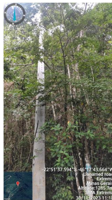
Figura 15. Árvore n.3