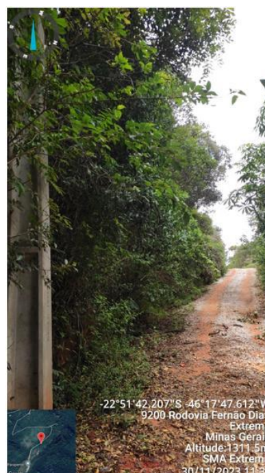
Figura 18. Área sem necessidade de supressão (sem copas de árvores na linha da rede), após árvore n.1