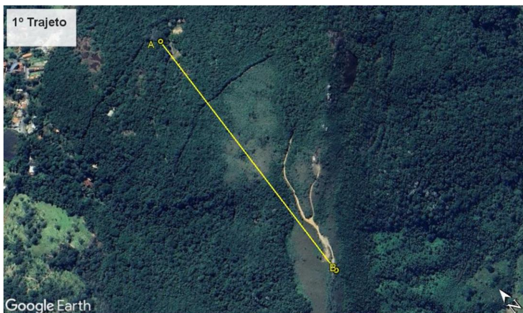
Figura 2. Alternativa 1 para o traçado da rede.

O Laudo Técnico Ambiental apresentou três alternativas para o traçado da rede de energia elétrica. De acordo com a autora do estudo, “a primeira alternativa de traçado da linha, embora com menor extensão, causaria maior impacto sobre a flora e a fauna em decorrência da abertura de faixa para implantação das estruturas, havendo necessidade de suprimir a vegetação nativa, provocando impacto direto sobre a flora e a fauna, tanto na implantação quanto na operação do empreendimento”, conforme Figura 2.