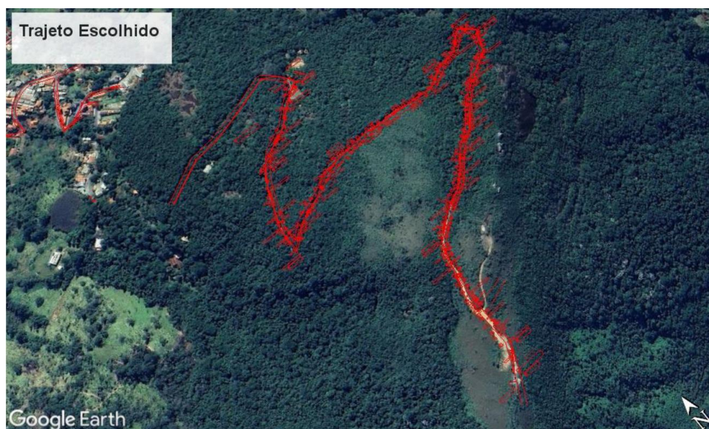
Figura 4. Alternativa 3 (escolhida) para o traçado da rede.

A terceira alternativa estudada, que foi a escolhida, segue em paralelo à estrada já existente (Figura 4), de forma a evitar áreas de vegetação densa ou habitats de espécies ameaçadas da flora, sendo necessário o corte de um número reduzido de árvores para a implantação do empreendimento. De acordo com a autora do estudo, a localização paralela à estrada existente favorece também a manutenção da rede após a energização devido ao fácil acesso.