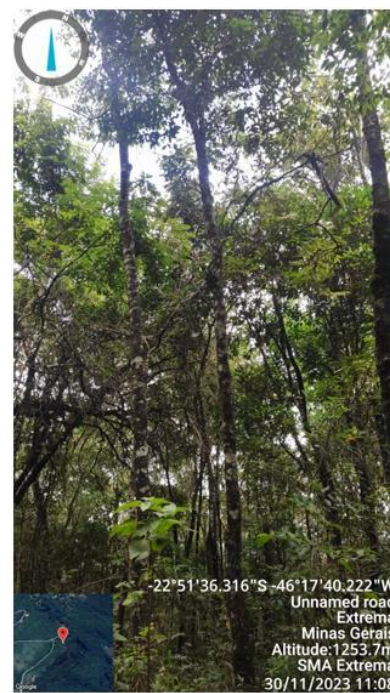
Figura 12. Árvore n.8