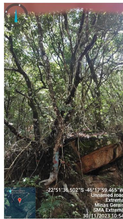
Figura 6. Árvore n.10, enraizada em rocha exposta