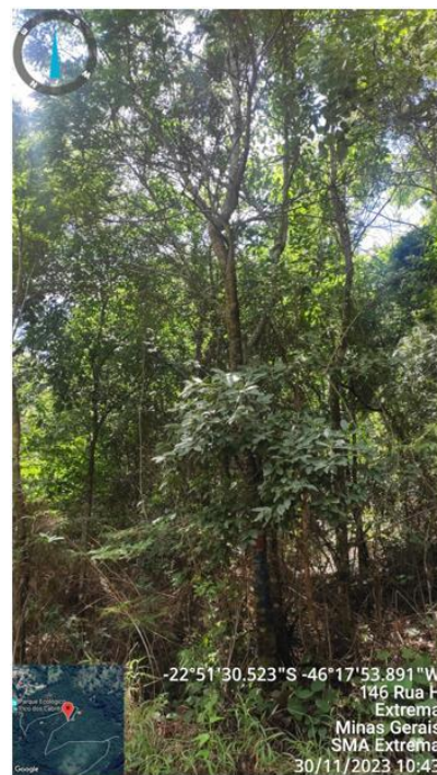
Figura 3. Árvores n.17 e 16