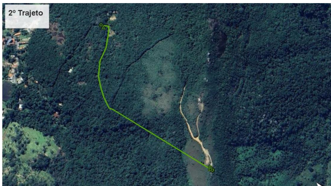
Figura 3. Alternativa 2 para o traçado da rede.

A segunda alternativa estudada teria maior impacto sobre a flora e, conseqüentemente, sobre a fauna devido a necessidade de abertura da faixa para implantação e operação da rede de energia, além de dificultar o acesso para a manutenção da operação, conforme Figura 3.