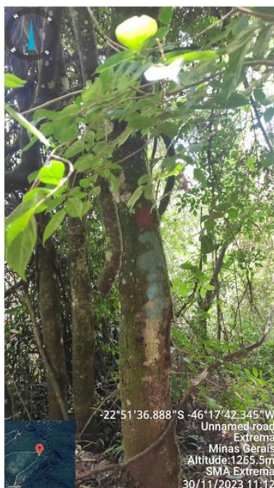
Figura 14. Árvore n.4