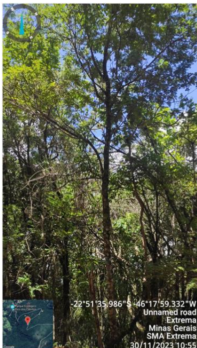
Figura 7. Árvore n.9