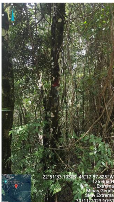
Figura 4. Árvore n.15 e 14