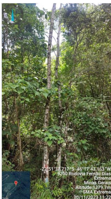
Figura 16. Árvores n.2 e 5