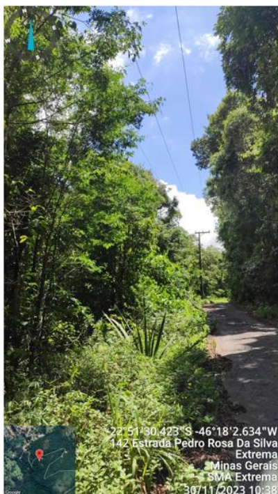
Figura 1. Rede existente