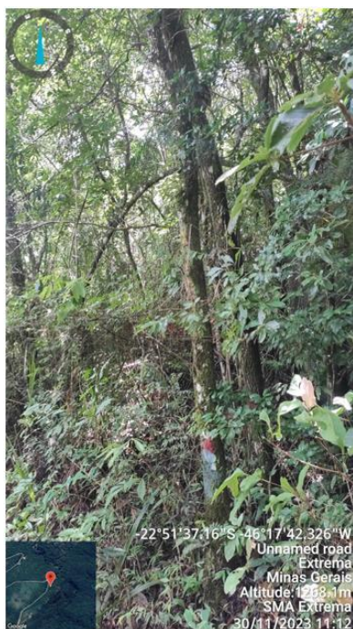
Figura 13. Árvore n. 7