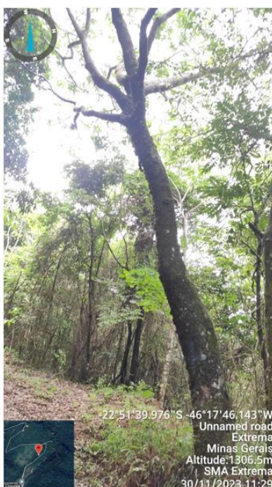
Figura 17. Árvore n.1