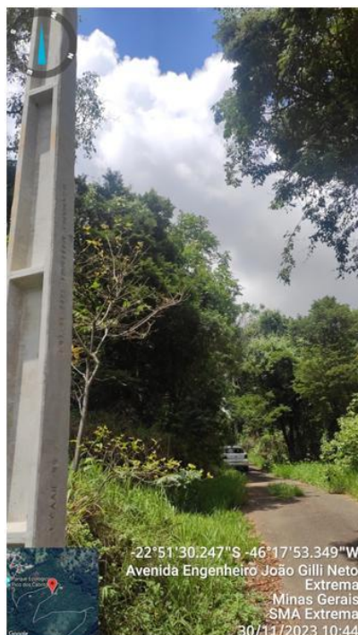
Figura 2. Início de extensão de rede