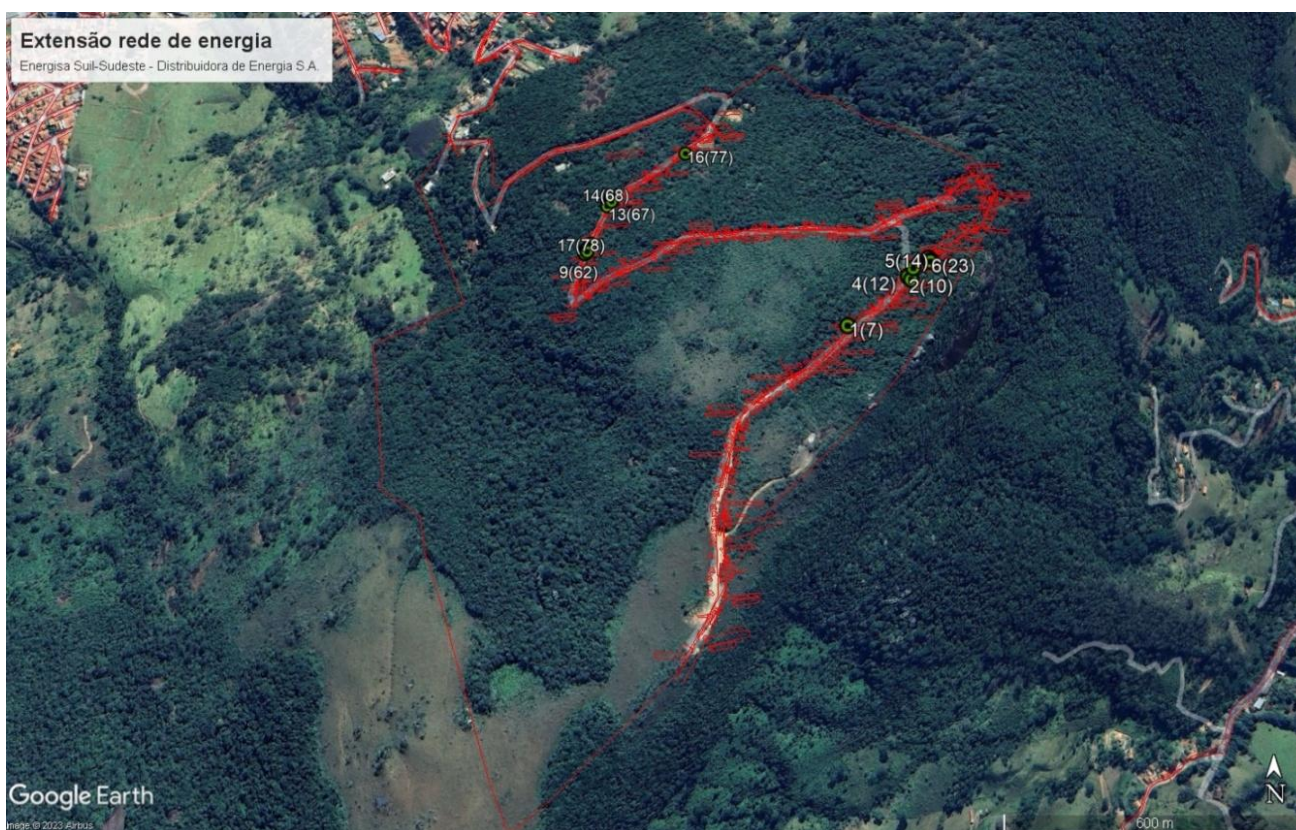
Figura 1. Localização do imóvel objeto da intervenção, com indicação dos espécimes a serem suprimidos em maciço florestal, ao longo de estrada de acesso existente no local.

De acordo com o Plano de Utilização Pretendida – PUP, a extensão da rede de energia implicará a supressão de vegetação secundária em estágio inicial de regeneração fora de APP (0,0071 ha), correspondendo ao corte de 17 árvores nativas. Nesse sentido, embora o PUP e o Laudo Técnico Ambiental, elaborado pela Bióloga Rafaela Bueno de Souza, CRBIO nº132661/01-D, ART nº 20231000109040, tenham indicado que a intervenção na vegetação implicará o corte de 17 árvores isoladas, importante esclarecer que a vegetação existente no local não se enquadra na definição de “árvores isoladas nativas” disposta no art. 2º, inciso IV do Decreto Estadual nº 47.749/2019, por se tratar de agrupamento de árvores cujas copas superpostas ou contíguas ultrapassam 0,2 hectare. Em análise à imagem de satélite da área em questão (Figura 1), verifica-se que a vegetação existente no local configura um maciço florestal do bioma Mata Atlântica.