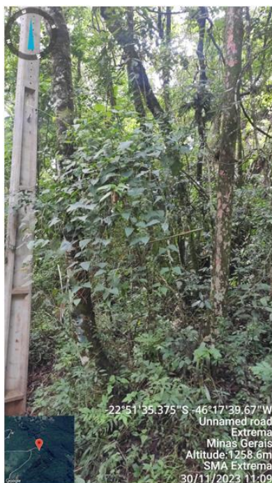
Figura 11. Árvore n.6