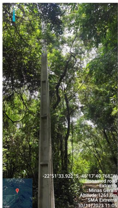
Figura 10. Área onde a rede passará por debaixo das copas das árvores