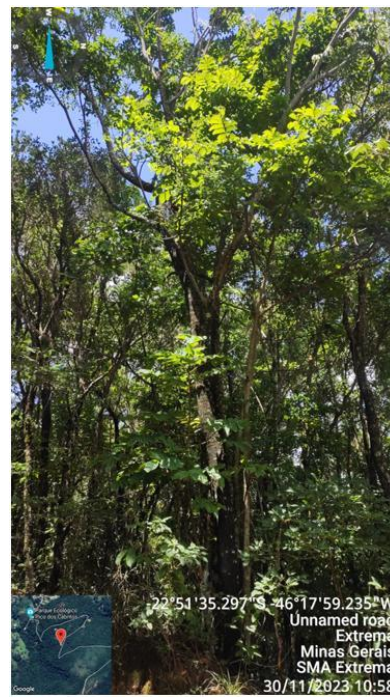
Figura 9. Árvore n.12