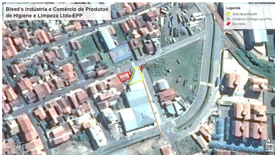
Figura 2 – Localização do empreendimento Bleed's Indústria e Comercio de Produtos de Higiene e Limpeza Ltda. EPP.

O entorno do empreendimento é caracterizado pela presença de residências e pontos comerciais, uma vez que está localizado em área urbana. Em verificação às imagens de satélite da área, verifica-se que a menor distância do terreno do empreendimento ao curso hídrico mais próximo (córrego Lavapés) é de 74 metros (Figura 1).