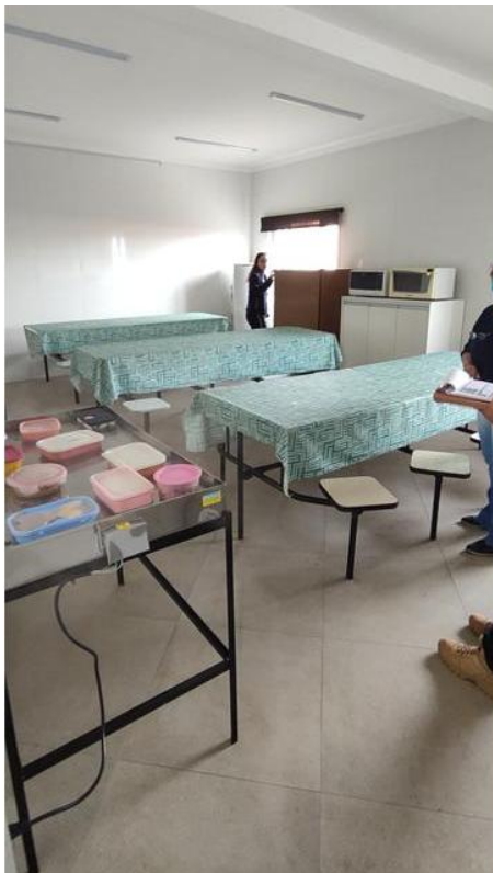
Figura 12. Refeitório/copa