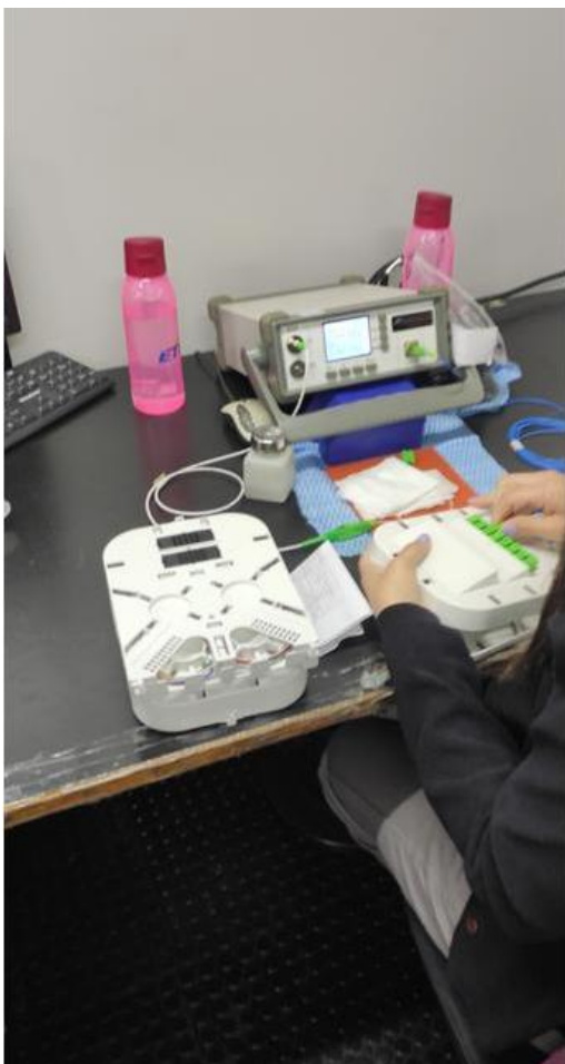
Figura 7. Área de testes de produtos acabados