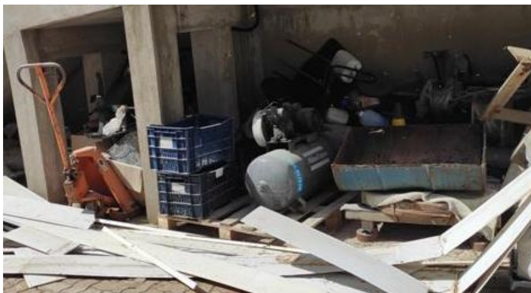
Figura 9. Compressor inativo