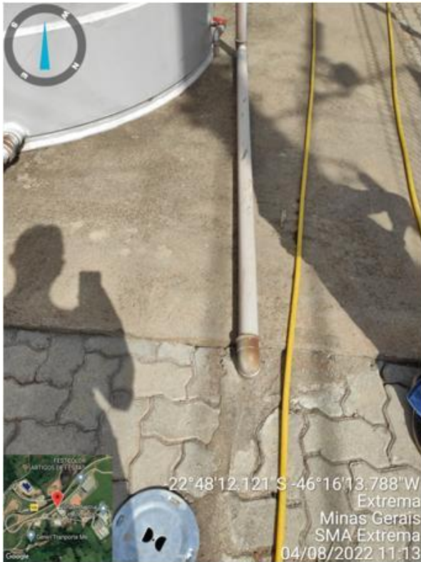
Figura 14. Tubulação de lançamento de efluente tratado da ETE.