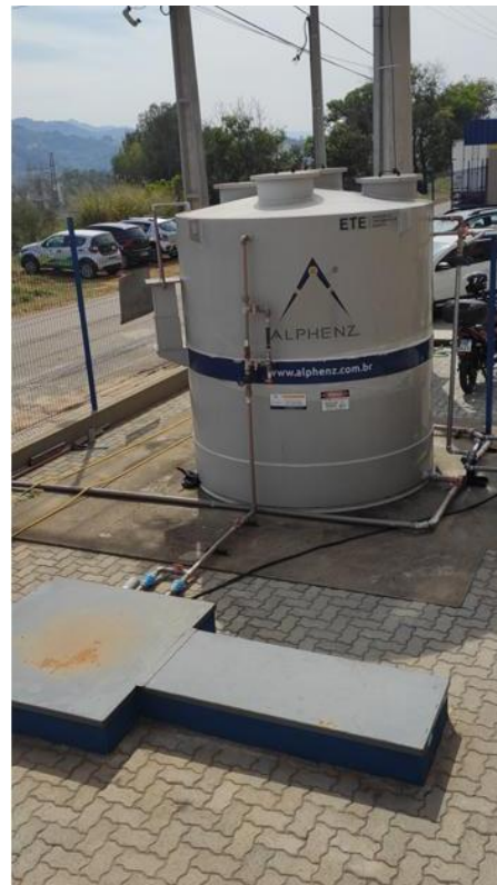
Figura 13. Sistema de tratamento de Efluentes Sanitários