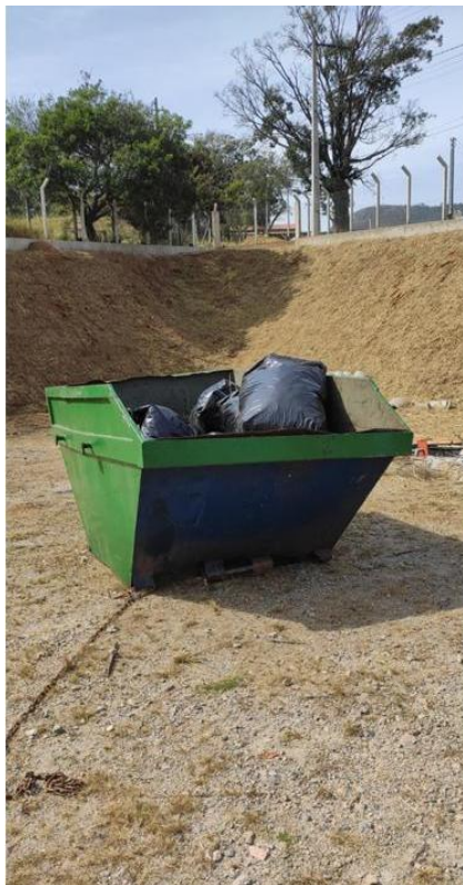
Figura 11. Caçamba de coleta de lixo comum