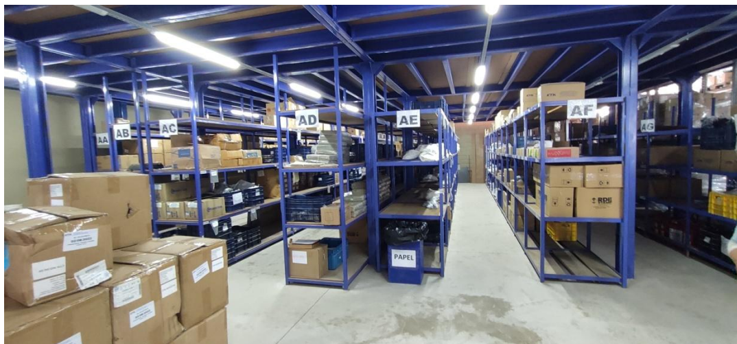
Figura 4. Estantes de armazenamento de pequenas peças