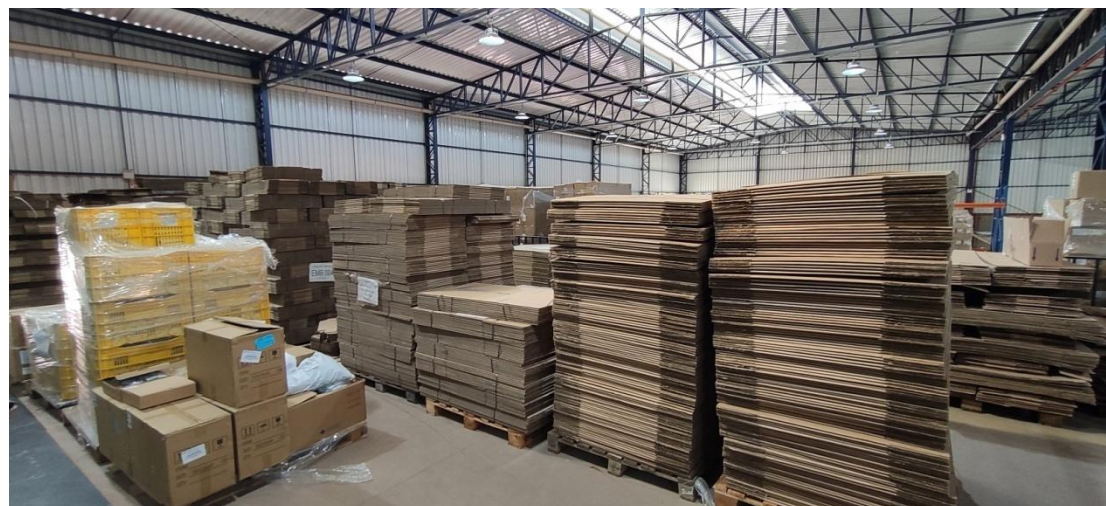
Figura 3. Mesanino de estocagem de embalagens