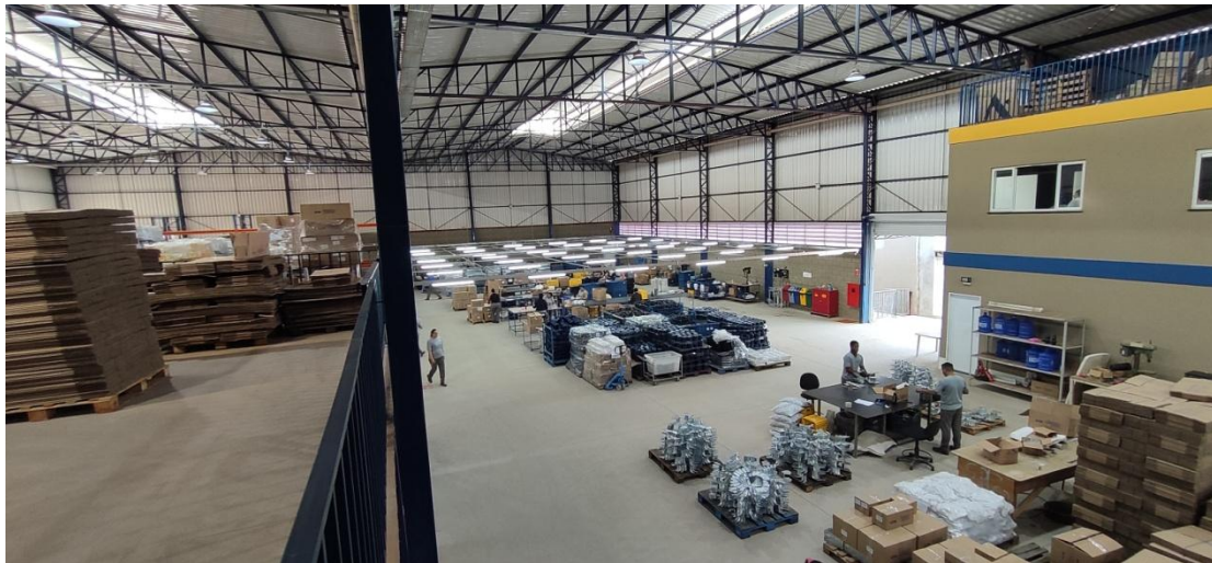
Figura 1. Vista geral da área interna