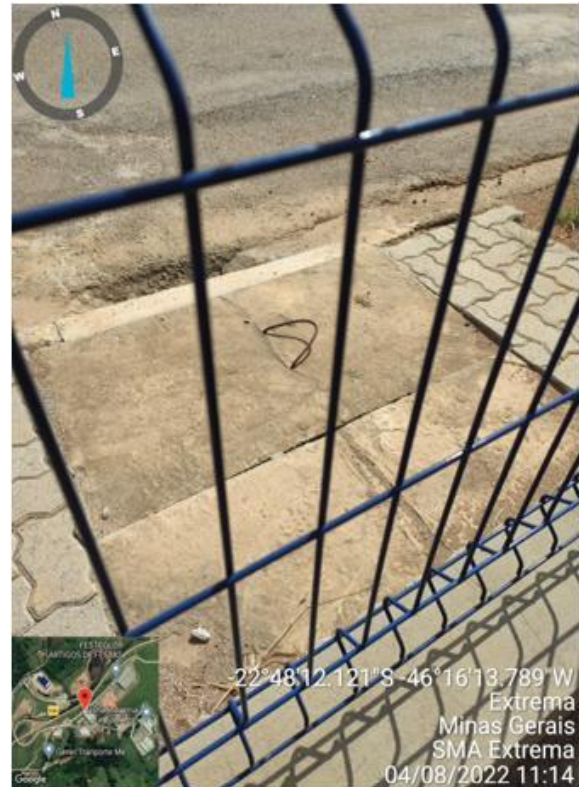
Figura 15. Ponto de lançamento de efluente tratado na rede de drenagem da via local