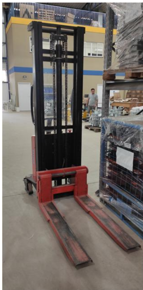
Figura 8. Empilhadeira elétrica utilizada na recepção de materias-primas