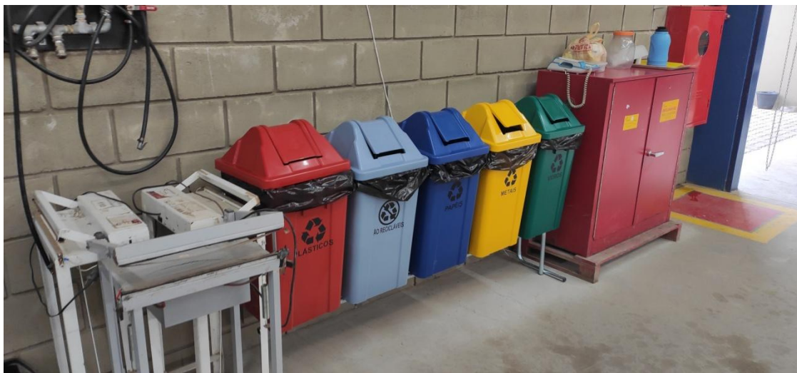
Figura 10. Coletores internos de resíduos