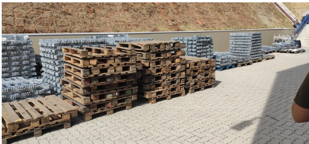
Figura 5 . Área de recepção de produtos, com armazenamento transitório de algumas peças metálicas e paletes de transporte