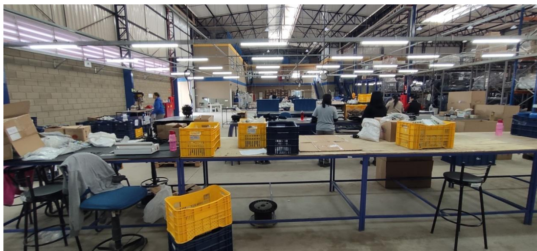
Figura 6 . Áreas/bancadas de montagem de equipamentos