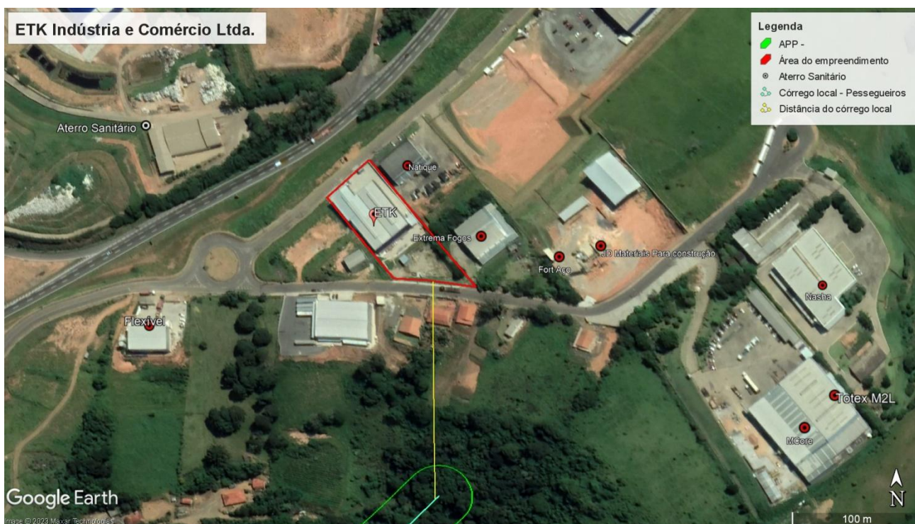
Figura 2. Localização do empreendimento.

Com relação à vegetação, observa-se a presença de árvores esparsas com predominância de campos antrópicos (pastagens). De acordo com imagens de satélite, a empresa está a cerca de 180 metros de distância de um dos córregos locais do Distrito Industrial dos Pessegueiros.