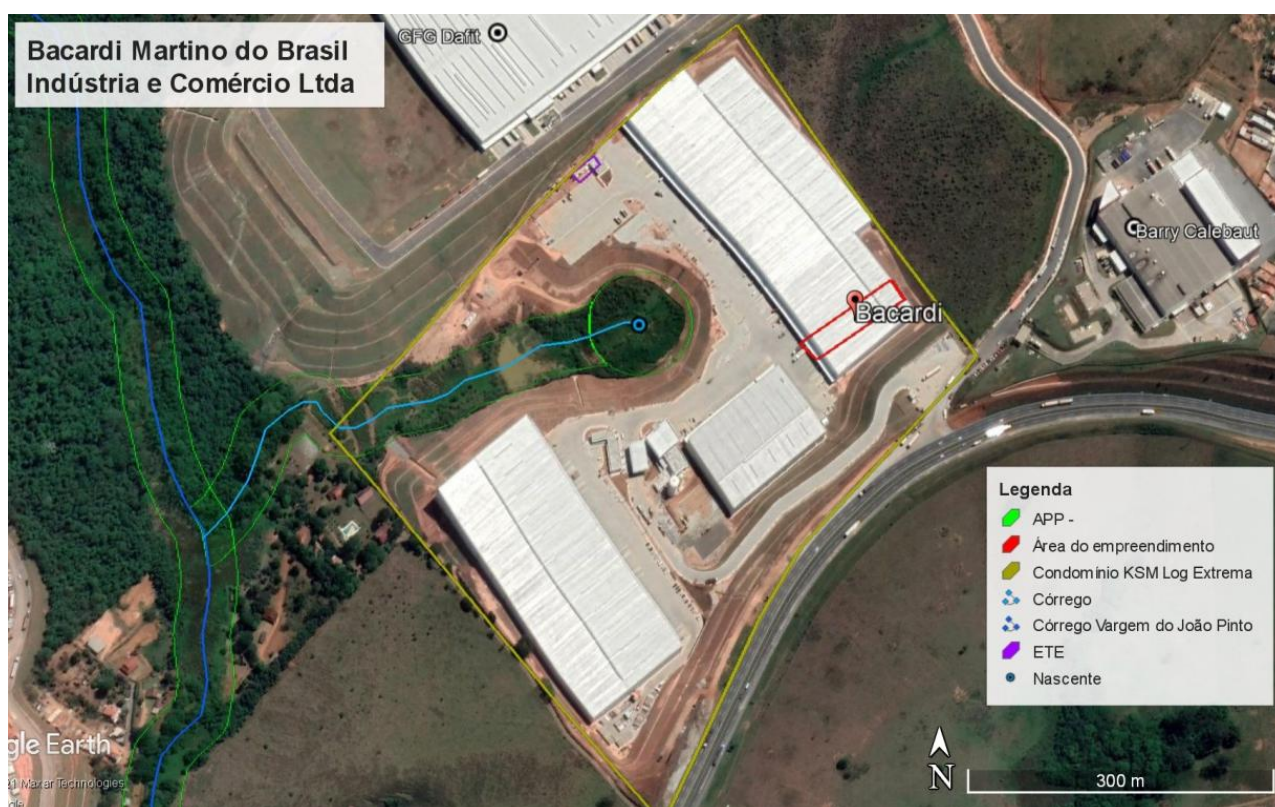
Figura 2. Localização do empreendimento.

Com relação à vegetação, observam-se campos antrópicos (pastagens) na região, além de remanescentes florestais, indústrias e residências no entorno. Há uma nascente com formação de córrego local no interior do condomínio logístico, sendo que o galpão e as áreas de apoio estão fora das Áreas de Preservação Permanente (APP) dos referidos corpos hídricos.