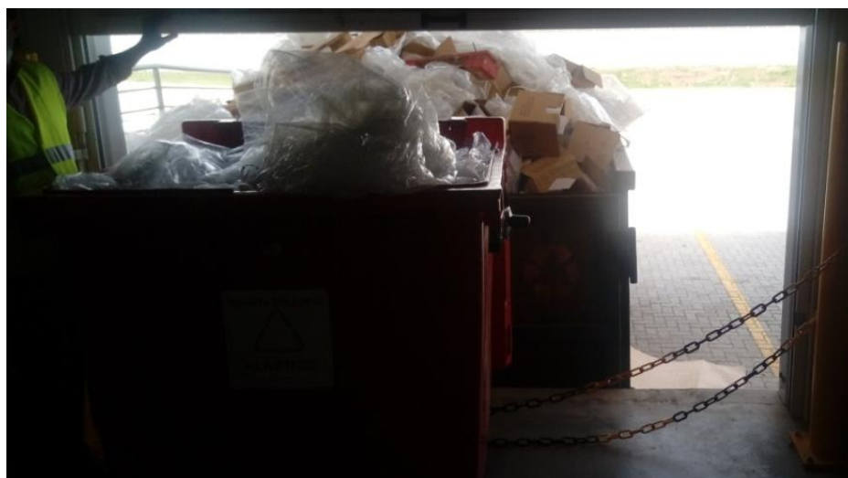
Figura 5. Armazenamento temporário de resíduos do empreendimento