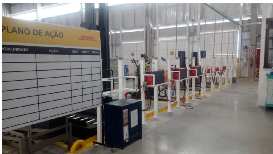
Figura 3. Sala de carregamento de baterias