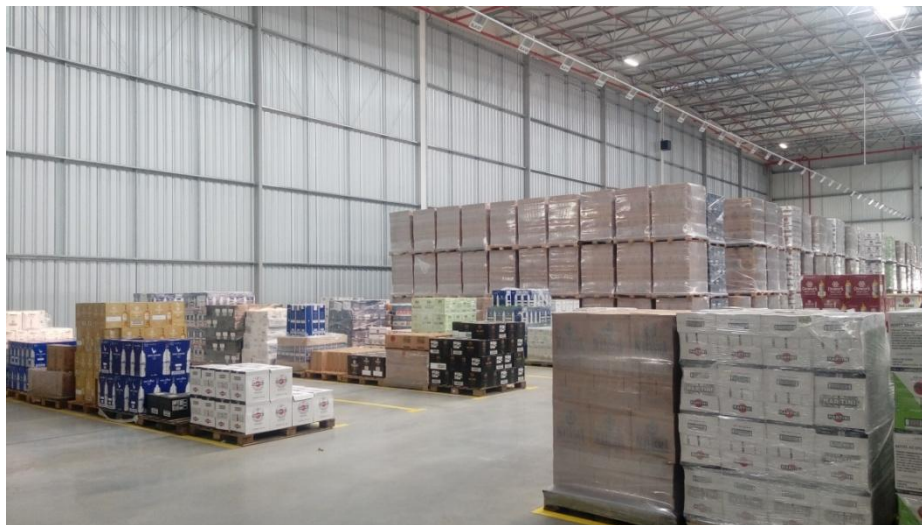
Figura 1. Vista interna da área de estocagem de produtos