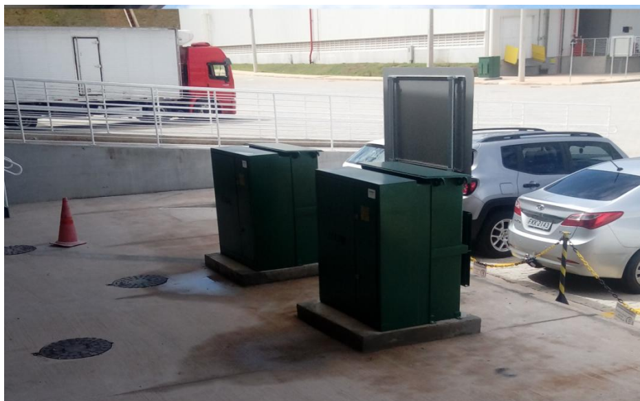
Figura 4. Área de uso de geradores suporte movidos a diesel.