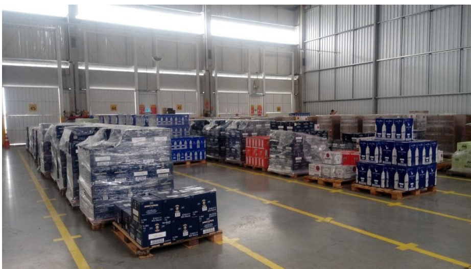
Figura 2. Vista interna da área de recebimento/distribuição