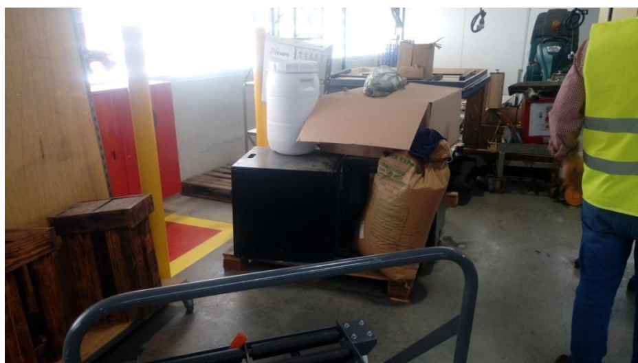
Figura 6. Armazenamento temporário de produtos para contenção de vazamentos