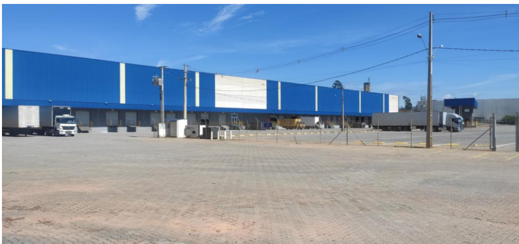
Figura 2. Visão geral de um do galpão 1.