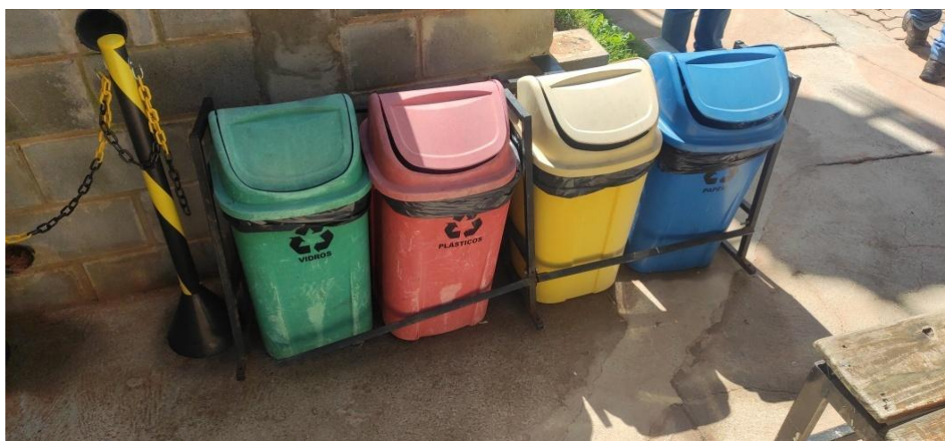
Figura 8. Coletores de resíduos do condomínio