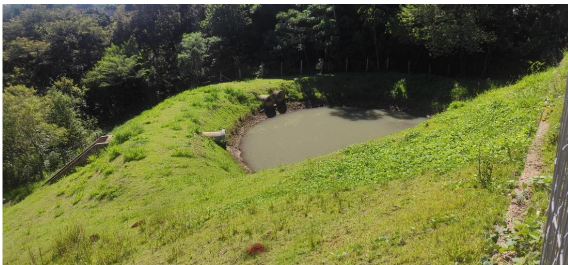
Figura 6. Caixa de retenção de águas pluviais Leste