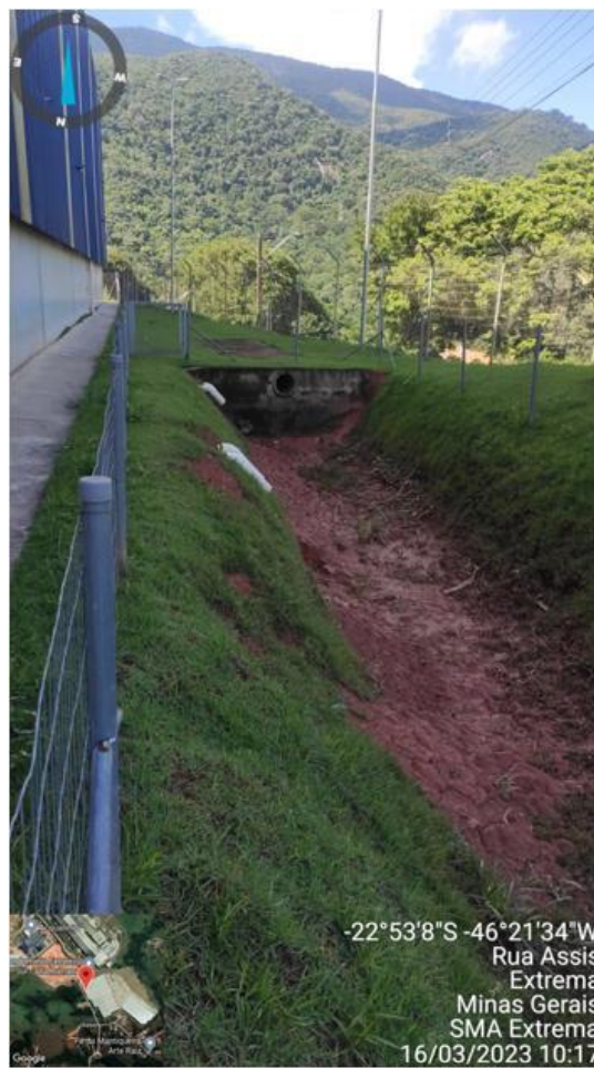
Figura 5. Caixa de retenção de águas pluviais Oeste