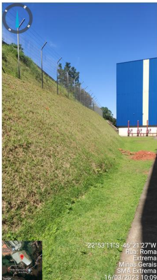
Figura 4. Taludes revegetado