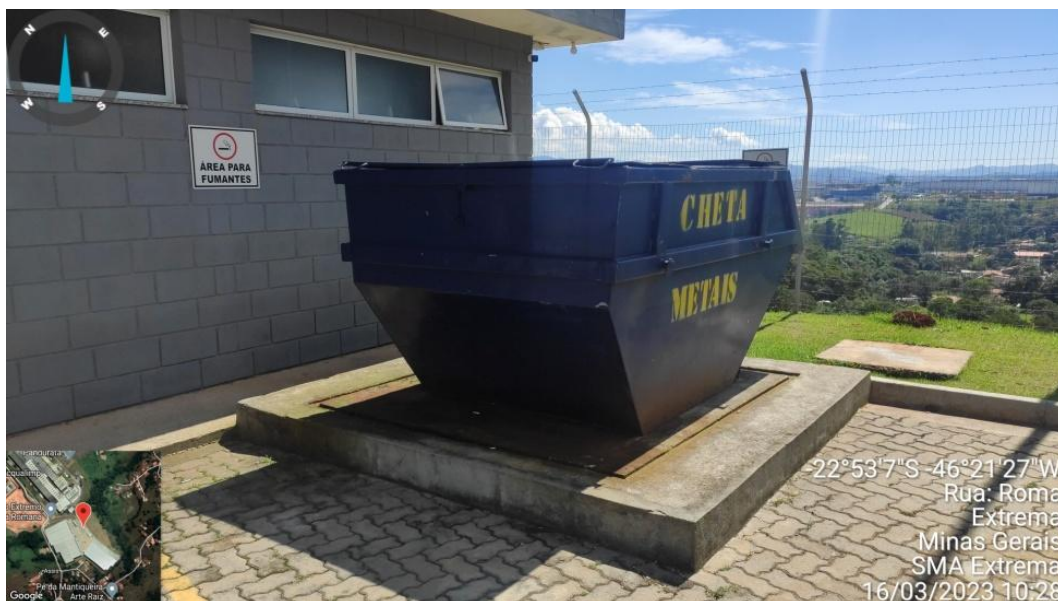
Figura 7. Caçamba de disposição de lixo comum/orgânico