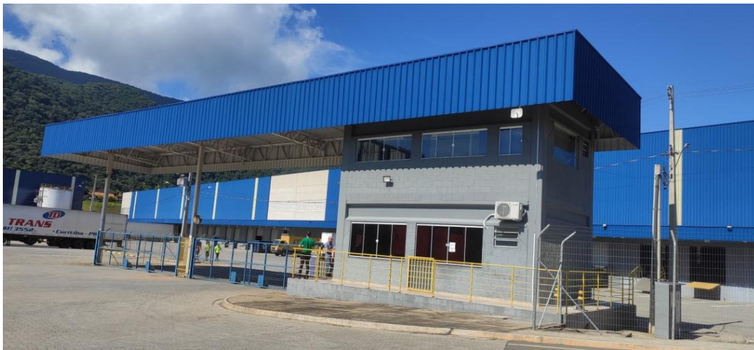
Figura 1. Portaria de entrada do empreendimento.