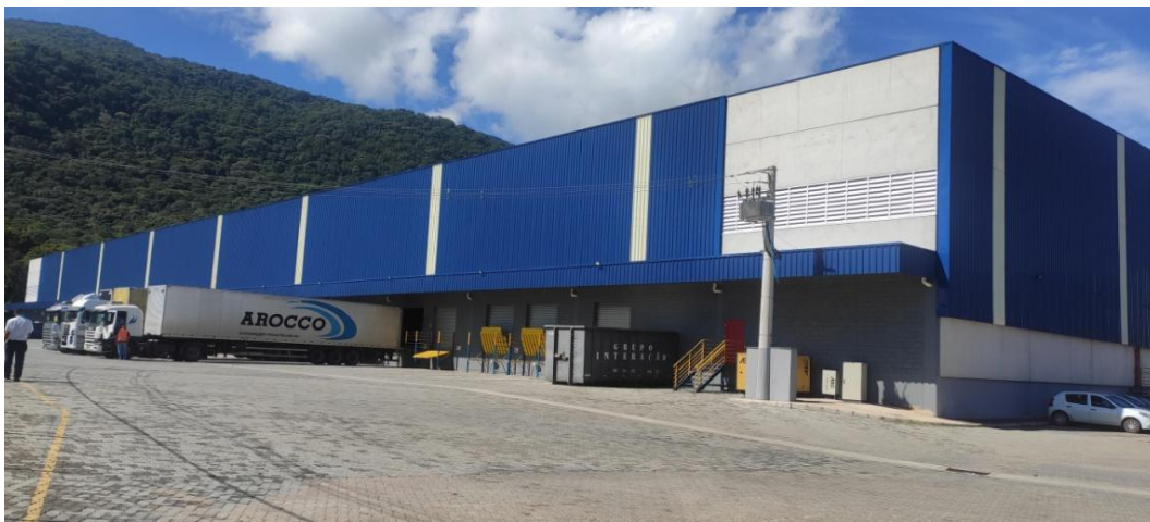
Figura 3. Visão geral do galpão 2.