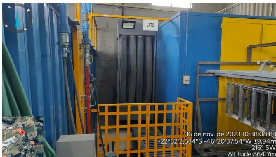
Figura 11. Filtro de mangas da câmara de jateamento