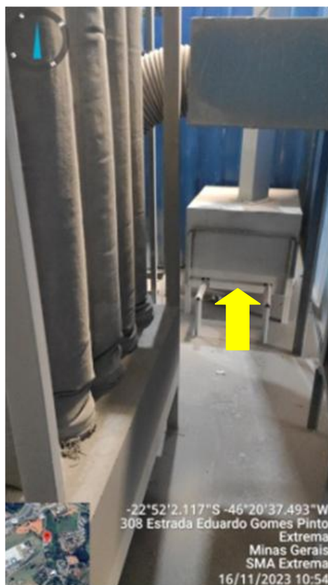
Figura 13. Filtro de mangas da área de pintura, com destaque para a armazenagem da tinta em pó recuperada