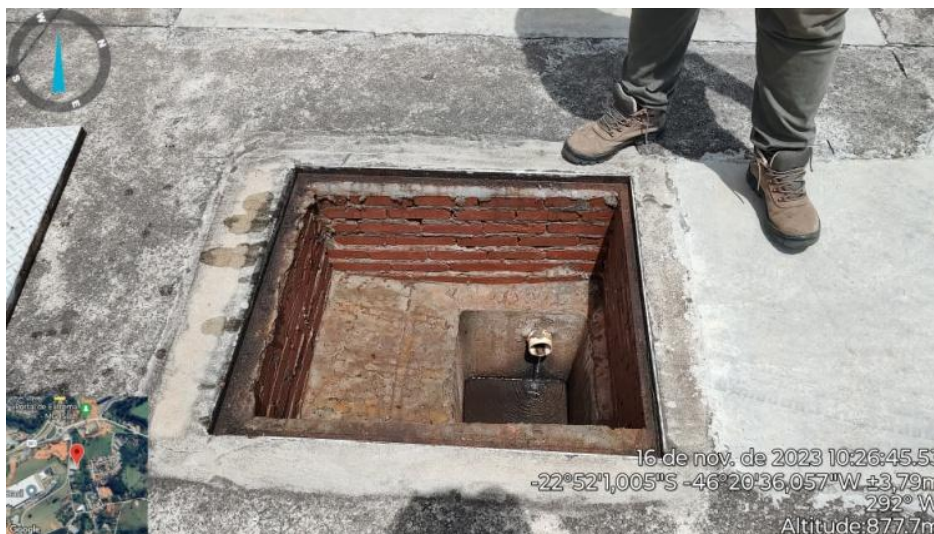
Figura 17. Saída efluente tratado Biodigestor do Galpão 307