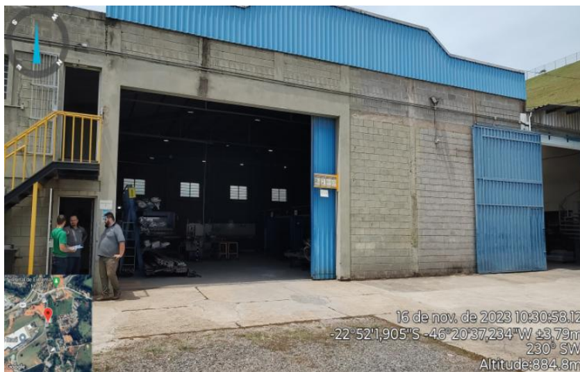
Figura 7. Vista externa das docas de recebimento e expedição no Galpão 305