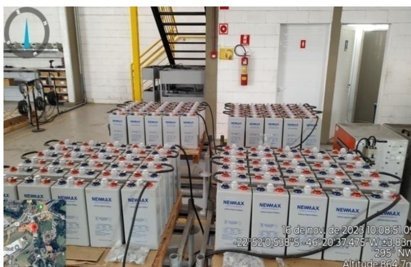
Figura 6. Área de manutenção e recarga das baterias