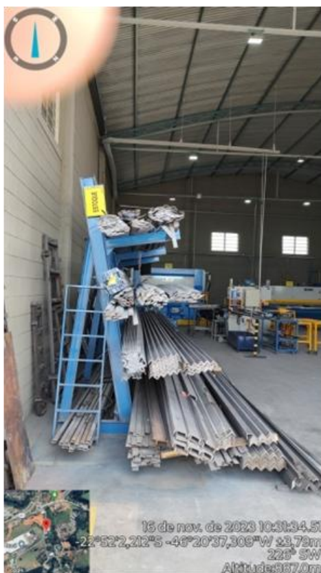
Figura 8. Armazenamento de matéria-prima