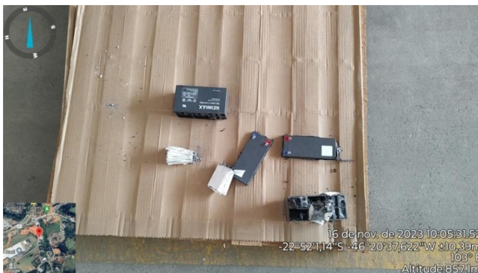
Figura 4. Amostra da bateria desmontada avariada.