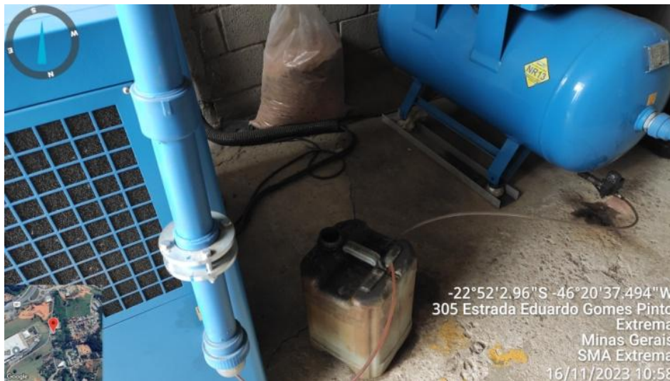
Figura 14. Armazenamento da água de purga