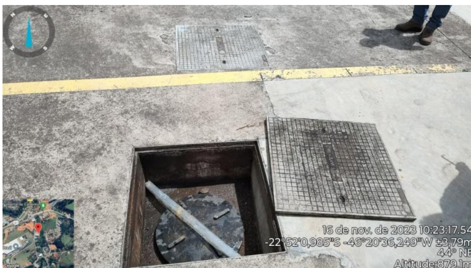
Figura 16. Biodigestor do Galpão 307