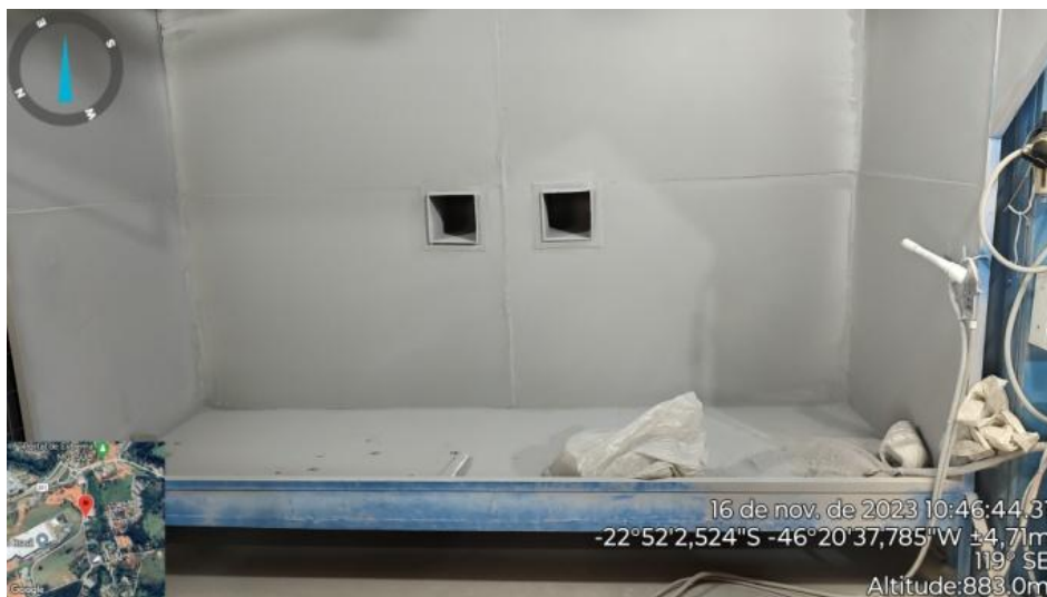
Figura 12. Cabine de Pintura