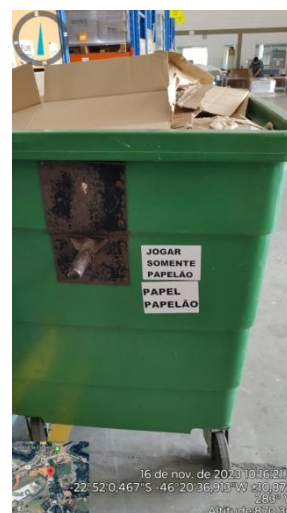
Figura 22. Contêiner interno, armazenamento de papelão