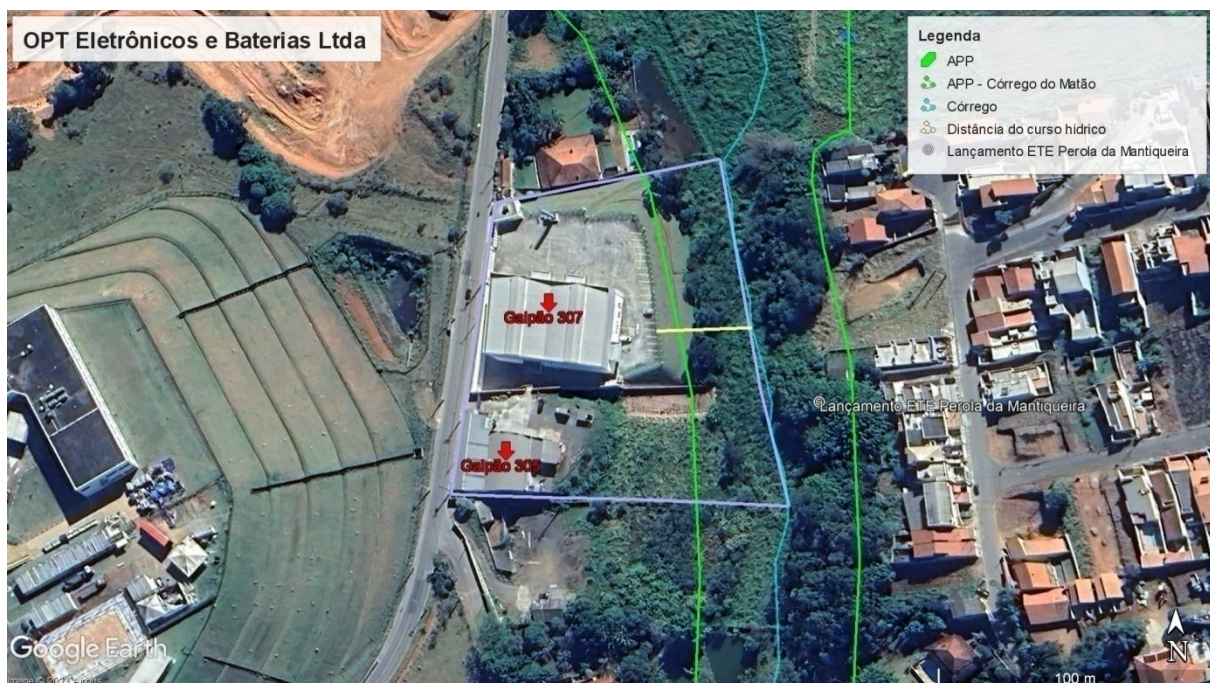
Figura 3. Localização do empreendimento.

Em análise à imagem de satélite da área em questão, por meio do software Google Earth Pro, verifica-se que a menor distância do limite do terreno do empreendimento até o córrego local é de aproximadamente 39 metros. Com relação à vegetação, no entorno há fragmentos de vegetação nativa e áreas de vegetação rasteira (pastagens).