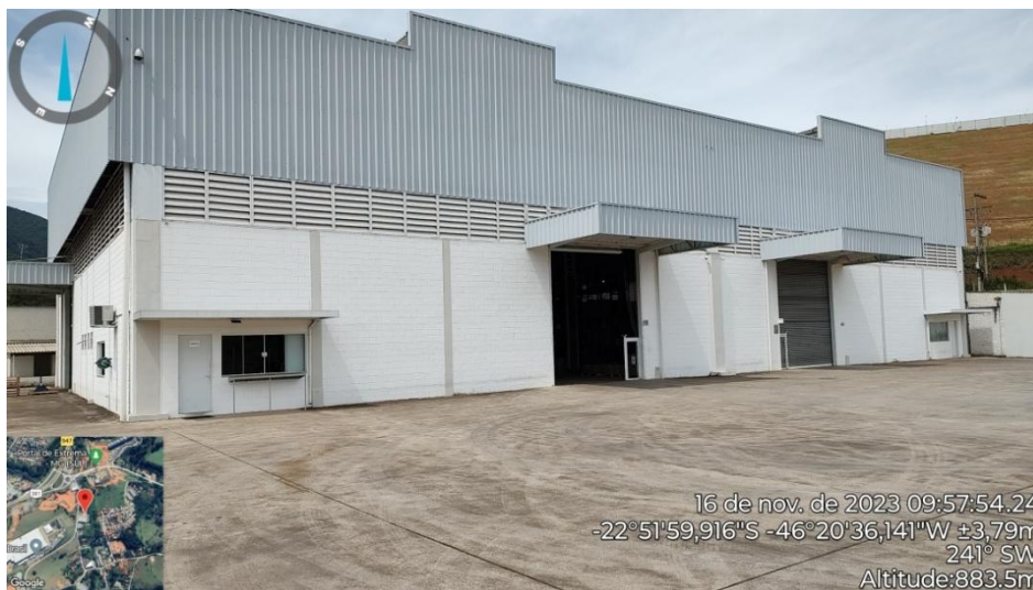
Figura 1. Vista externa das docas de recebimento e expedição no Galpão 2