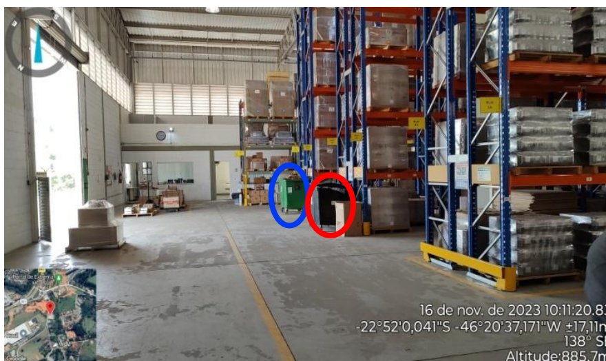
Figura 20. Contêineres internos, armazenamento de plástico e papel