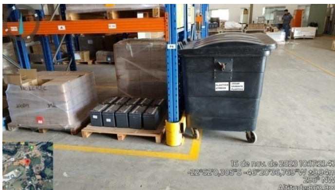
Figura 21. Contêiner interno, armazenamento de plástico