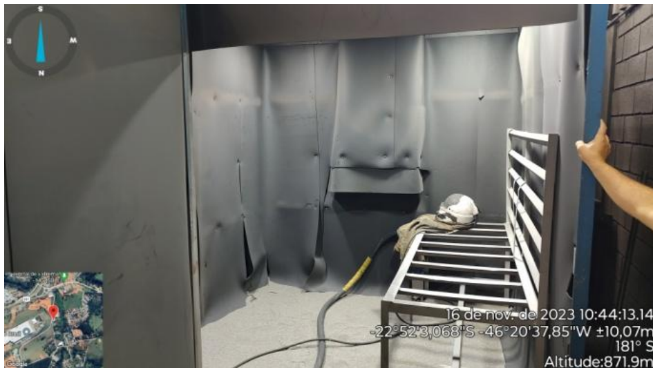
Figura 10. Câmara de Jateamento