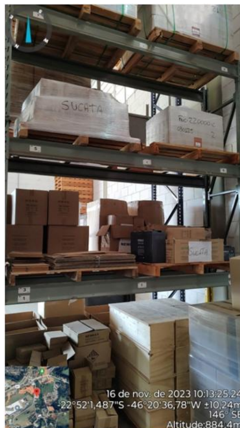
Figura 3. Local de armazenamento de baterias avariadas.