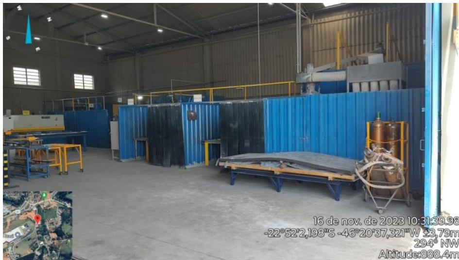
Figura 9. Visão geral interna da área de fabricação, jateamento e pintura