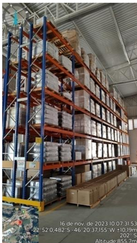
Figura 2. Visão geral interna do empreendimento e área de estocagem de baterias.