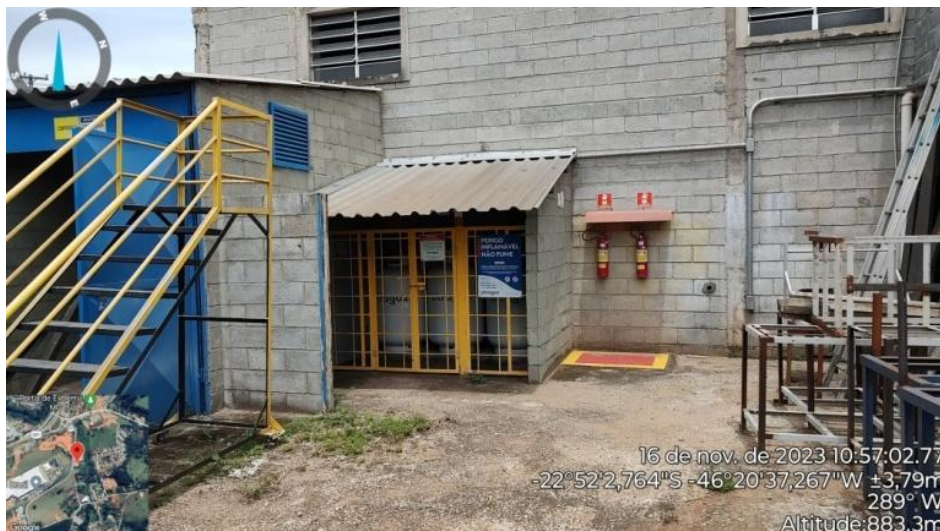
Figura 15. Área externa leste do galpão 305, área de armazenamento de GLP e sala dos compressores