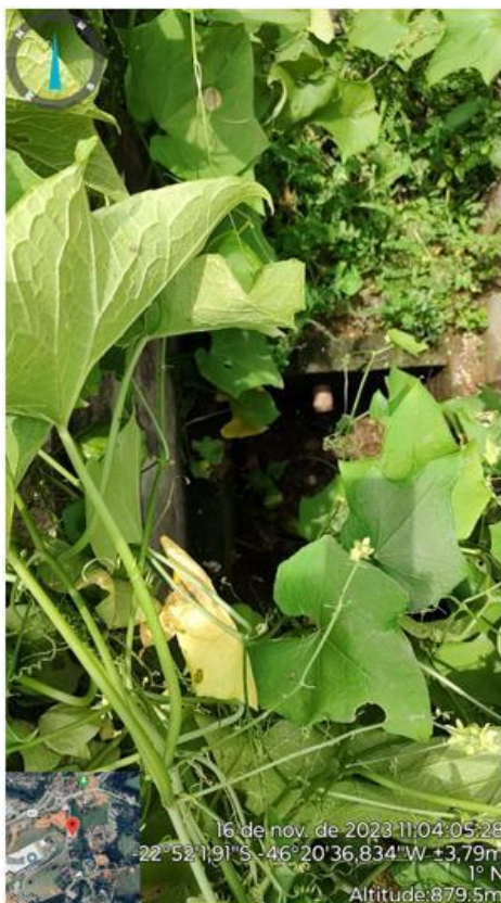
Figura 18. Caixa de acesso ao Biodigestor do Galpão 305 (com vegetação acima)