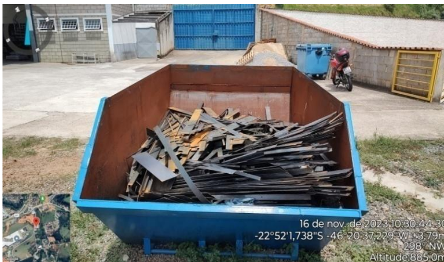
Figura 19. Caçamba onde realiza-se o armazenamento de resíduo metálico