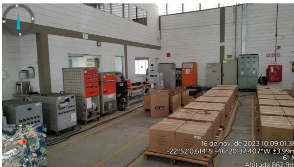
Figura 5. Área de manutenção e recarga das baterias