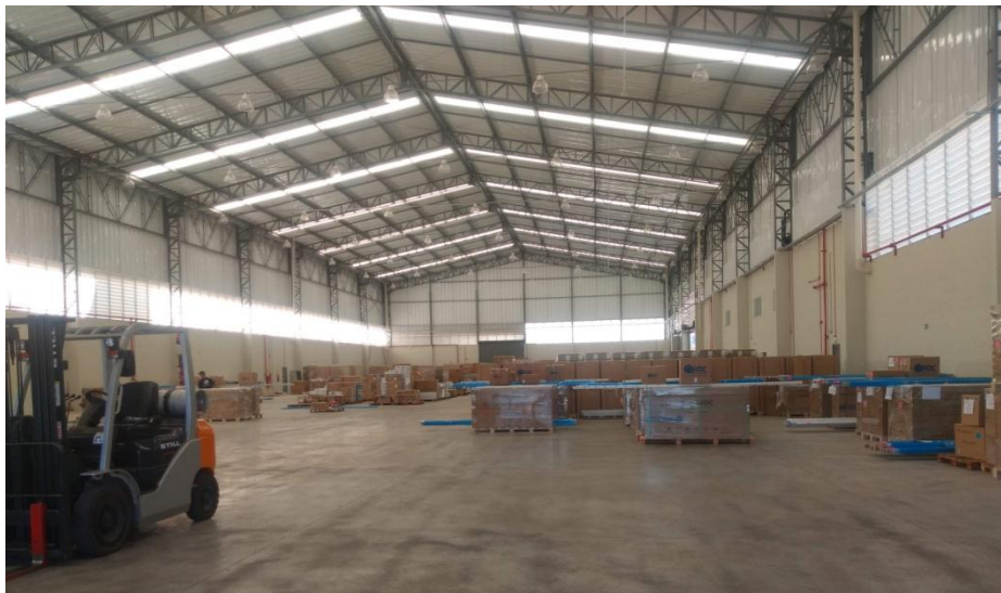
Figura 1. Vista interna do galpão de produção e estocagem