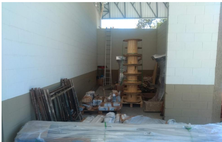
Figura 8. Área de armazenamnto temporário de resíduos (não utilizada para este fim no momento da vistoria)