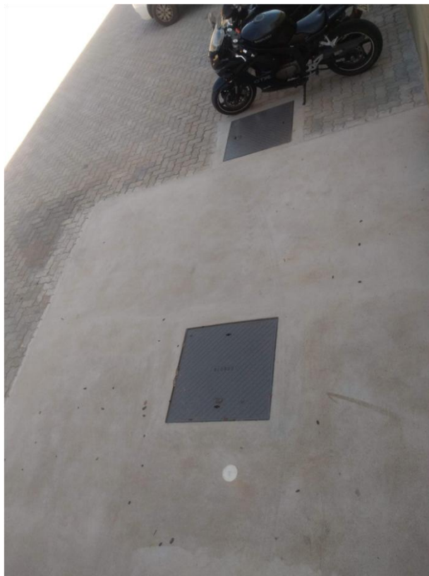
Figura 9. Tampas da Fossa Séptica e biodigestor do sistema de tratamento de efluentes.