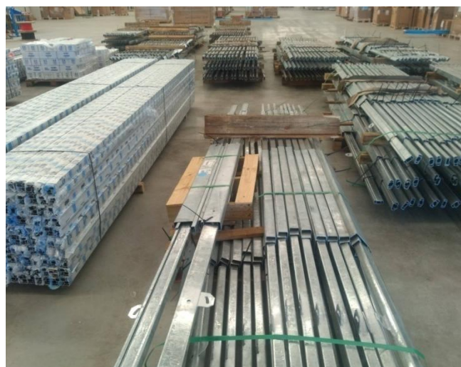
Figura 3. Armazenamento de estruturas metálicas para suporte a painéis fotovoltaicos