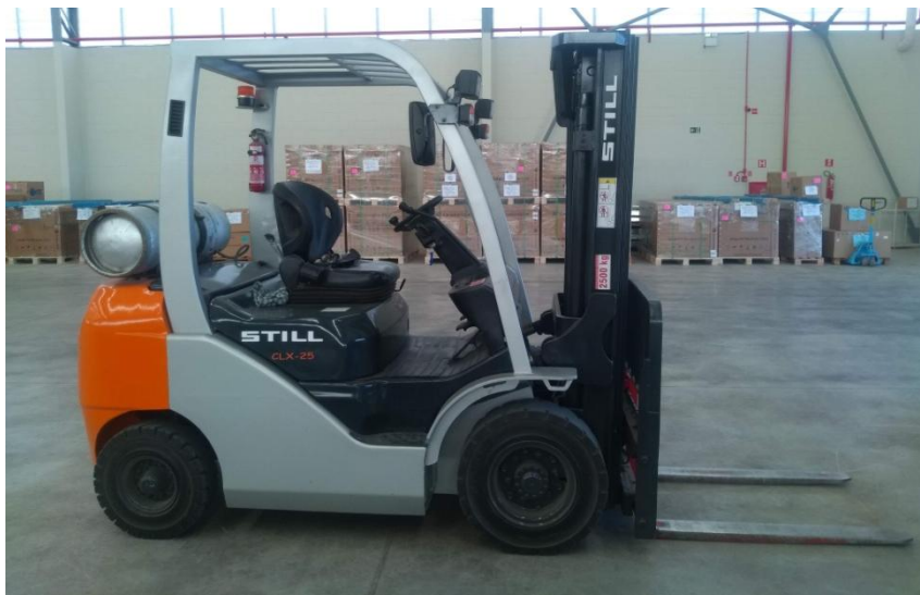
Figura 5. Empilhadeira a gás GLP utilizada no empreendimento.