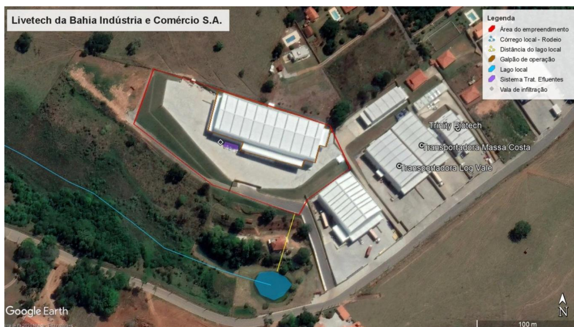
Figura 2. Localização do empreendimento.

Com relação à vegetação, observam-se campos antrópicos (pastagens) na região, além de remanescentes florestais, indústrias e residências no entorno. Há uma nascente com formação de córrego local próximo ao empreendimento, de modo que o galpão e áreas de apoio distam cerca de 58 metros dos referidos corpos hídricos, estando, portanto, fora das respectivas Áreas de Preservação Permanente - APP.