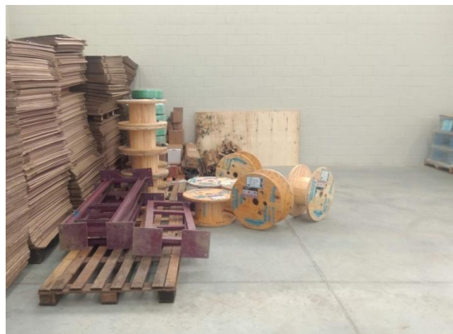
Figura 7. Armazenamento temporário de carretéis de madeira