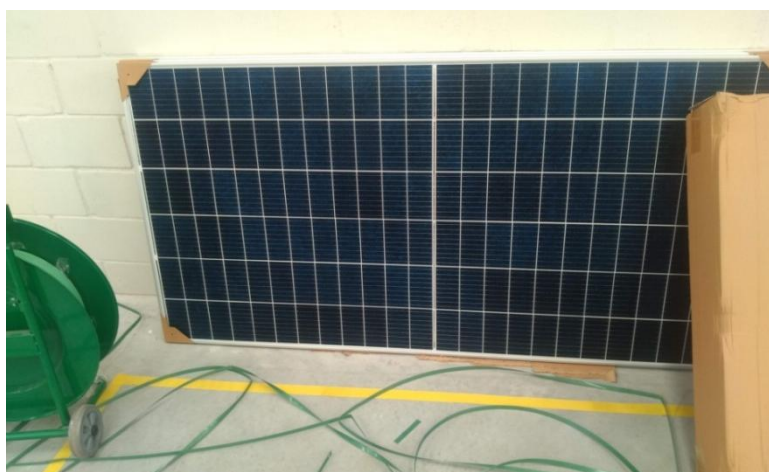
Figura 4. Modelo de painel fotovoltaico recebido para montagem com o kit gerador