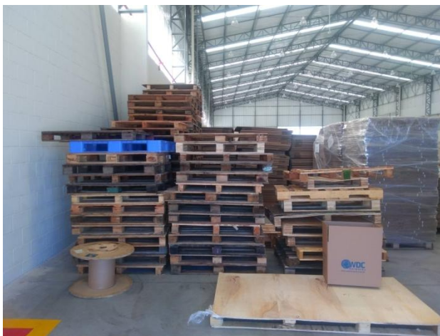
Figura 6. Armazenamento temporário de paletes de madeira