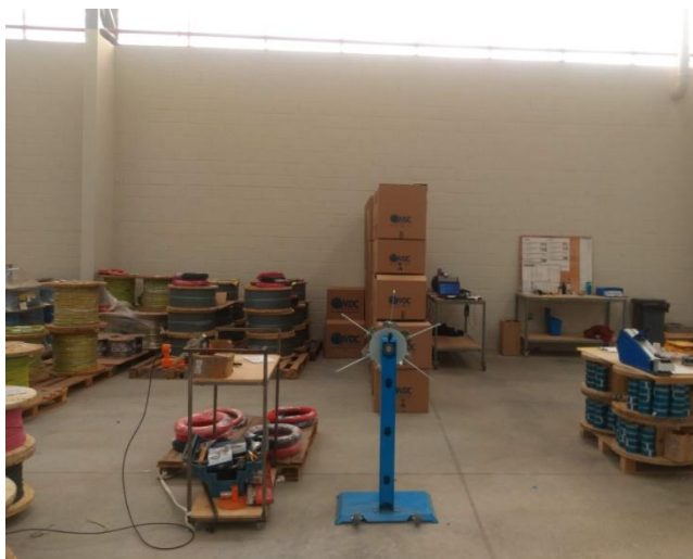
Figura 2. Vista da área de armazenamento e corte de cabos