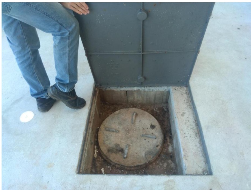
Figura 10. Evidência do sistema instalado.