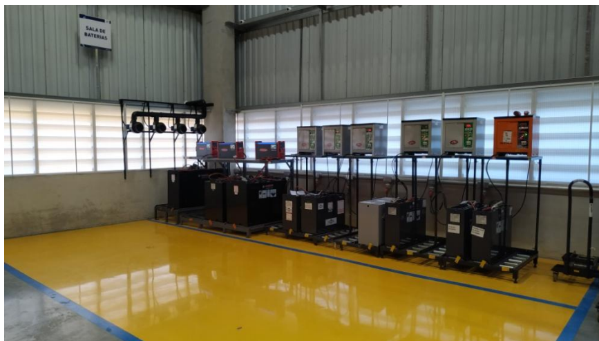
Figura 5. Sala de carregamento de baterias