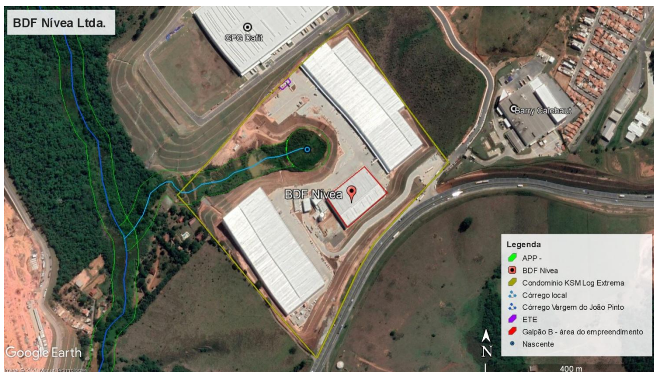
Figura 2. Localização do empreendimento.

Com relação à vegetação, observam-se campos antrópicos (pastagens) na região, além de remanescentes florestais, indústrias e residências no entorno. Há uma nascente com formação de córrego local no interior do condomínio logístico, sendo que o galpão e as áreas de apoio estão fora das Áreas de Preservação Permanente (APP) dos referidos corpos hídricos.