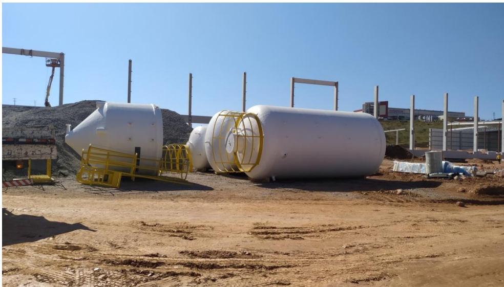
Figura 7. Estruturas da Estação de Tratamento de Efluentes a ser instalada (em 07/07/2020).