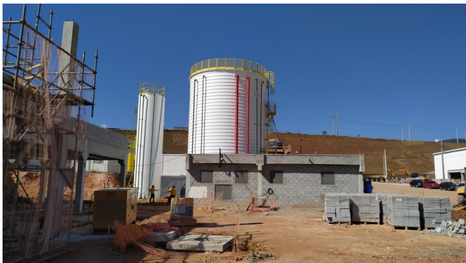
Figura 9. Caixa d'água em finalização para atendimento ao condomínio.