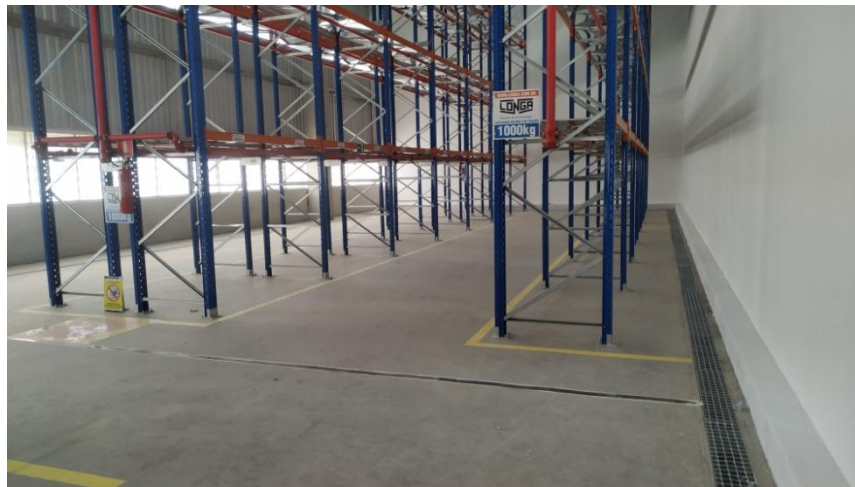
Figura 4. Vista da área de armazenamento de produtos inflamáveis e aerossóis.