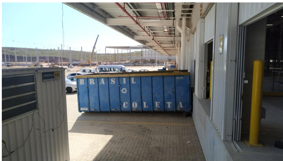
Figura 8. Doca de armazenamento temporário de resíduos do empreendimento