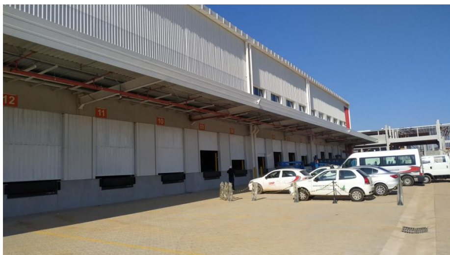
Figura 3. Área externa frontal do centro de distribuição Nívea