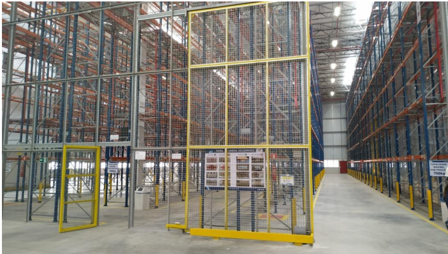
Figura 1. Vista interna da área de estocagem de produtos “não classificados”