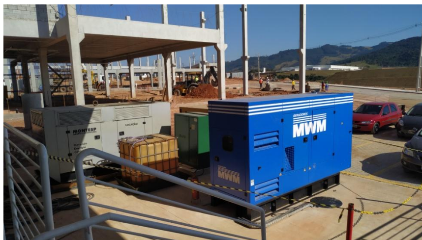
Figura 6. Área de uso de geradores suporte movidos a diesel.