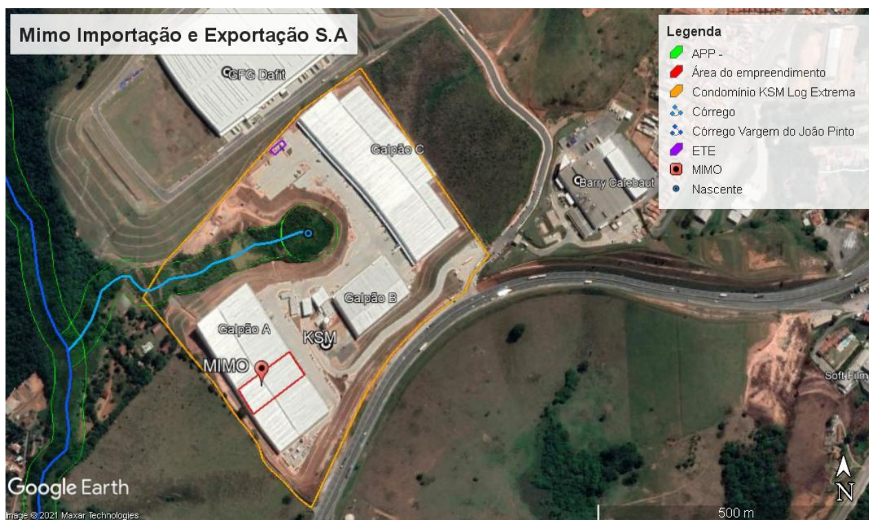
Figura 2. Localização do empreendimento.

Com relação à vegetação, observam-se campos antrópicos (pastagens) na região, além de remanescentes florestais, indústrias e residências no entorno. Há uma nascente com formação de córrego local no interior do condomínio logístico, sendo que o galpão e as áreas de apoio estão fora das Áreas de Preservação Permanente (APP) dos referidos corpos hídricos.