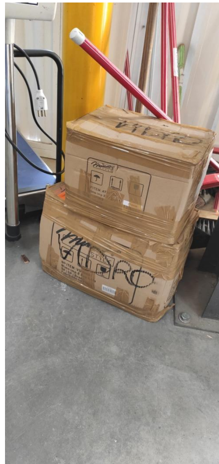
Figura 6. Armazenamento temporário de produtos avariados