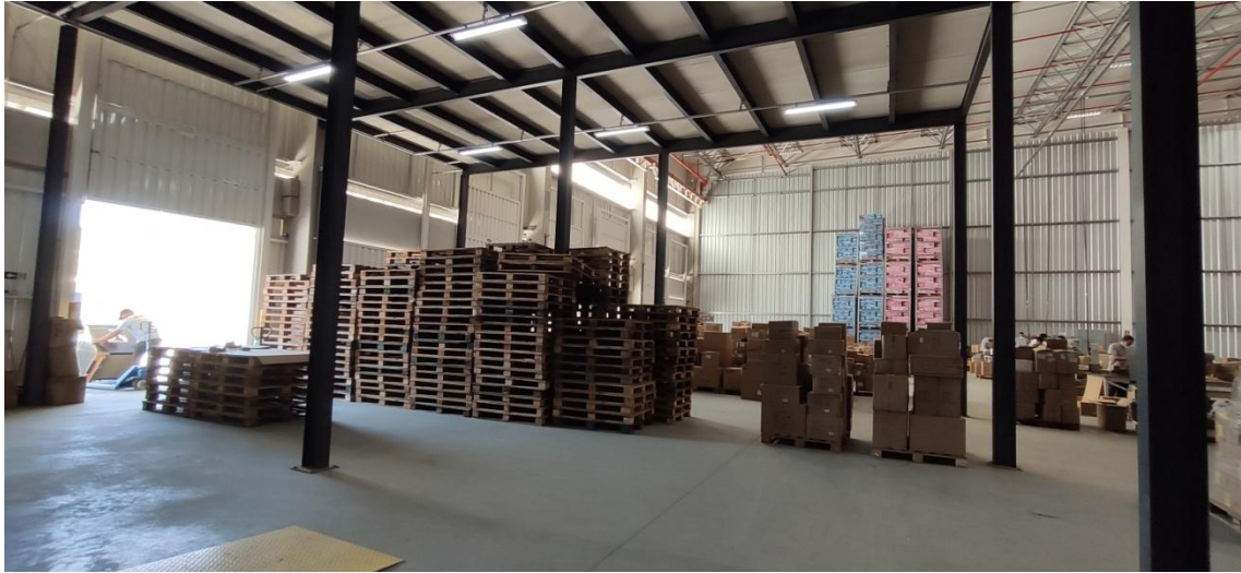
Figura 1. Vista interna da área de recebimento e distribuição