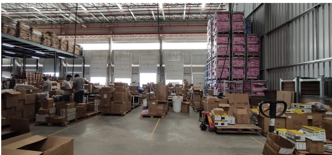
Figura 12. Vista interna da área de embalagem e expedição