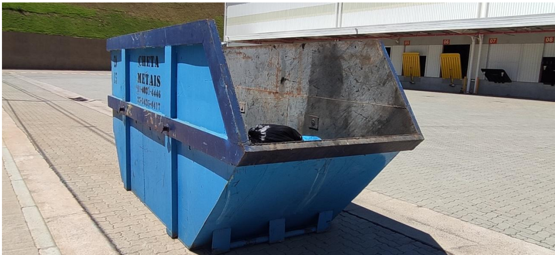
Figura 8. Armazenamento temporário de resíduos comuns (Área comum do condomínio)