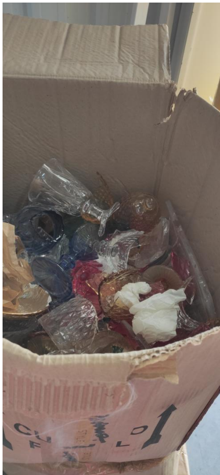
Figura 5. Segregação de produtos avariados (vidros quebrados)