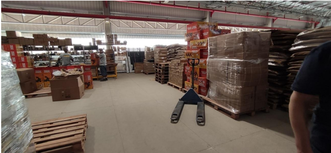
Figura 4. Área de estocagem de kits para reserva - Mezanino