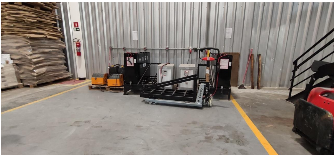
Figura 9. Área de carregamento de baterias