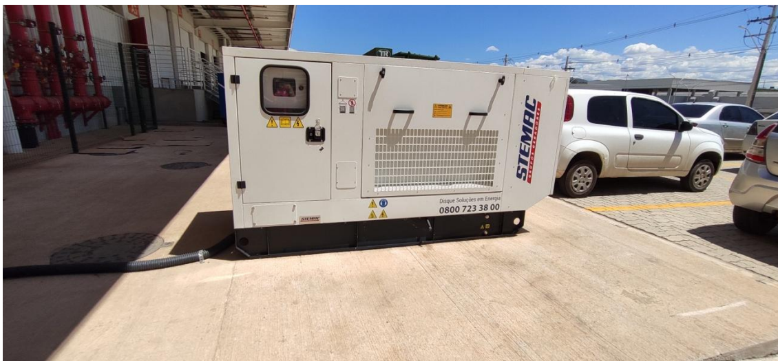
Figura 10. Área destinada ao gerador a diesel.