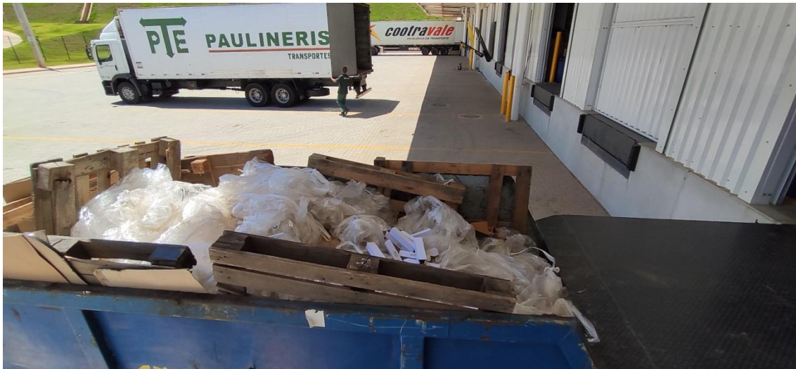
Figura 7. Armazenamento temporário de resíduos recicláveis do empreendimento