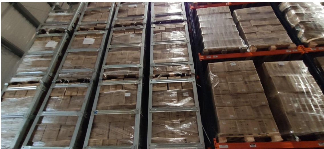
Figura 3. Área de estocagem – Estantes provisórias e estantes porta-paletes fixas