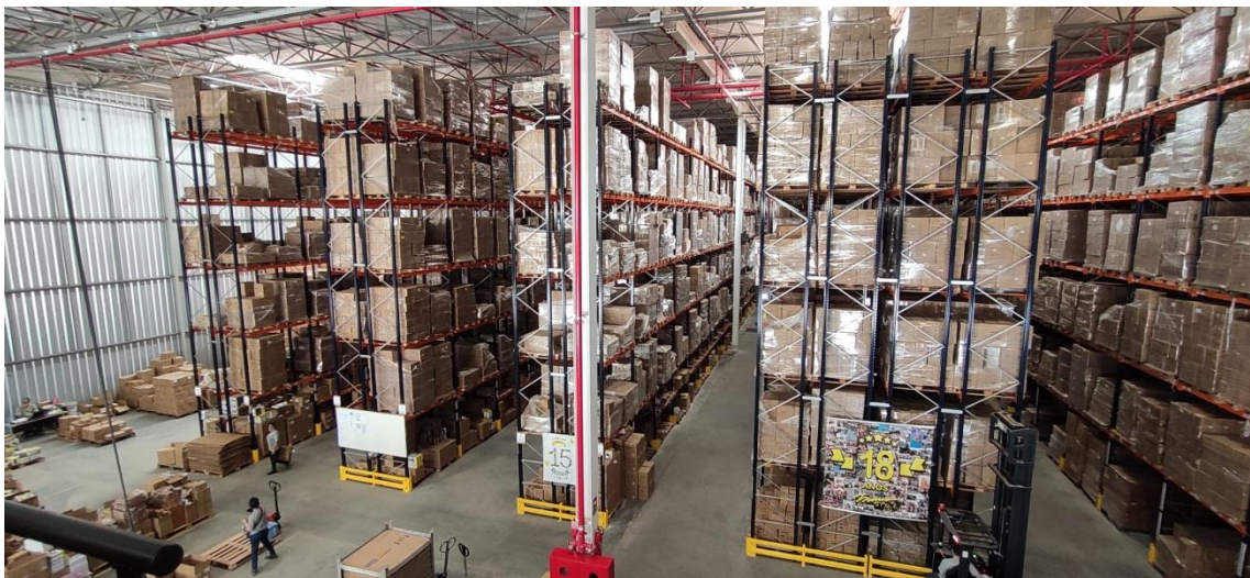
Figura 2. Área de estocagem de produtos - Térreo