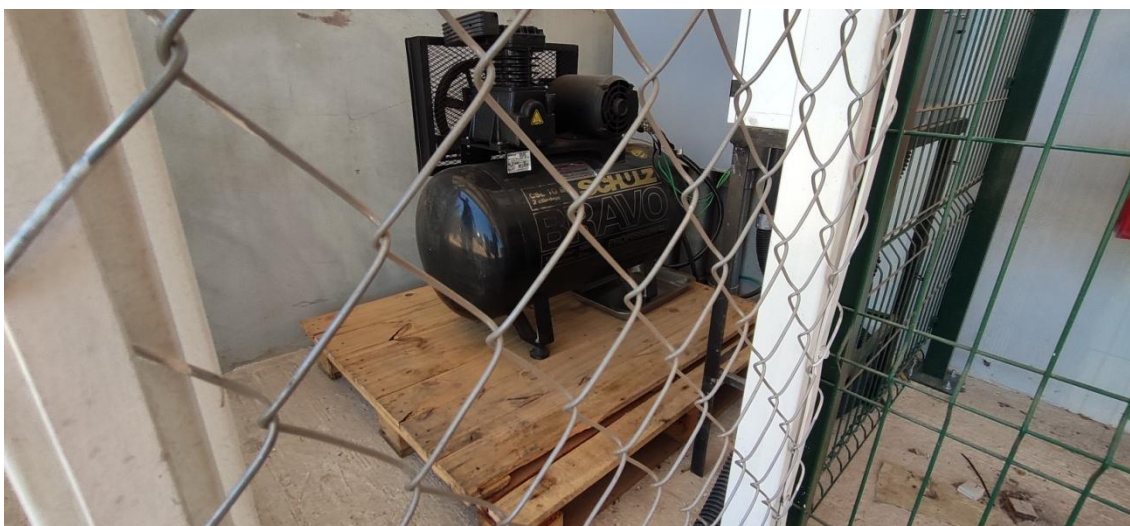
Figura 11. Área destinada ao compressor.